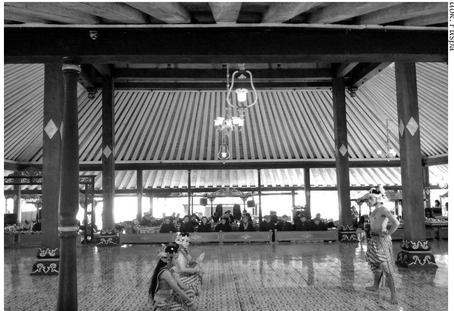
Minggu (21/2) Pertunjukan Wayang Wong Mataram

Banyak wisatawan telah memenuhi kursi sebelum acara dimulai. Ada pula, wisatawan yang duduk di sisi kanan atau kiri Bangsal