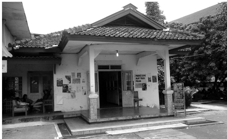
Jumat (26/02) Kondisi kantin FBS